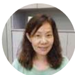
湯 芝 瑩

剛開始作者只給幾個線索：披毛衣、雷達耳、靈活後腿，關鍵則是「慵懶的躺在大碗盆裡」，或許這時你已猜出毛小孩哪哪是隻貓。小作者描寫哪哪在主人做各種事時會開啟撒嬌、害怕等模式，觀察細膩，讓人看了不禁會心一笑。